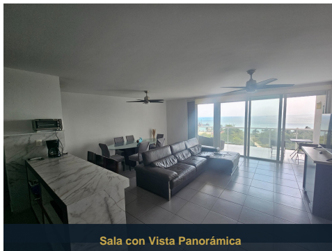
Sala con Vista Panorámica