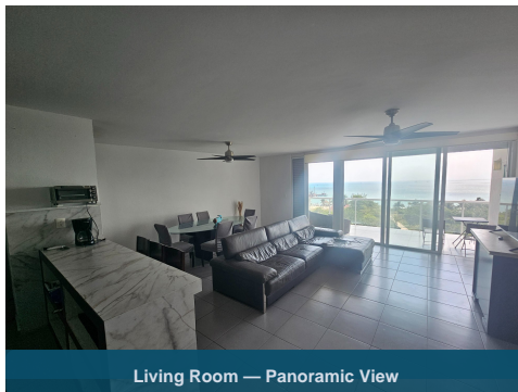
Living Room — Panoramic View