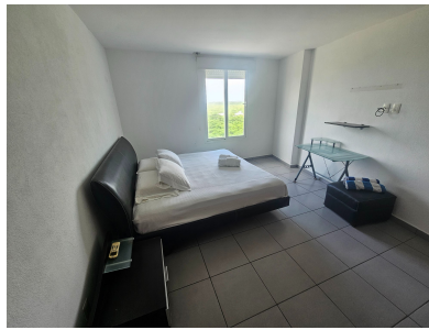
Segunda Recámara — Vista Estacionamiento