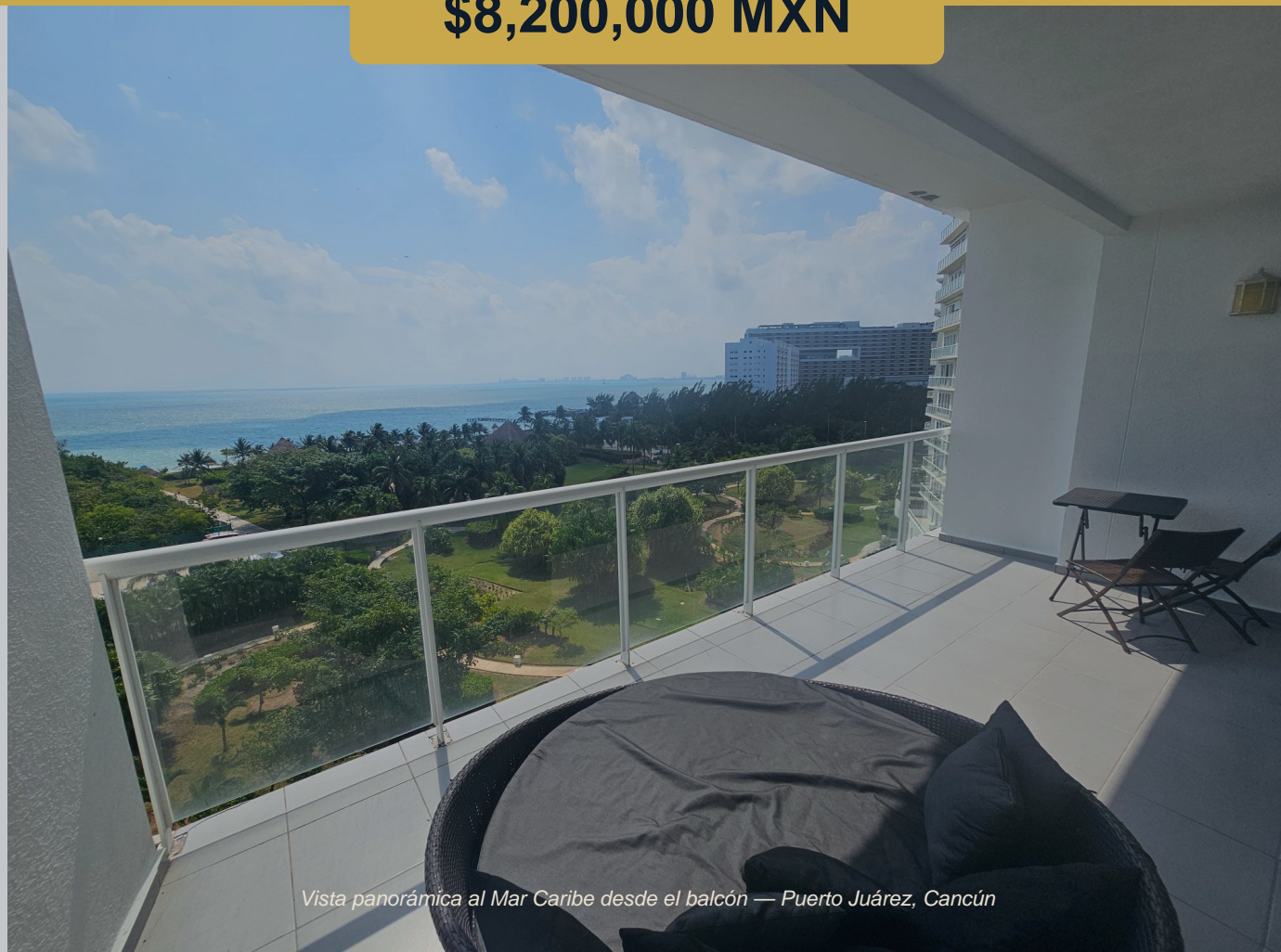
Vista panorámica al Mar Caribe desde el balcón — Puerto Juárez, Cancún