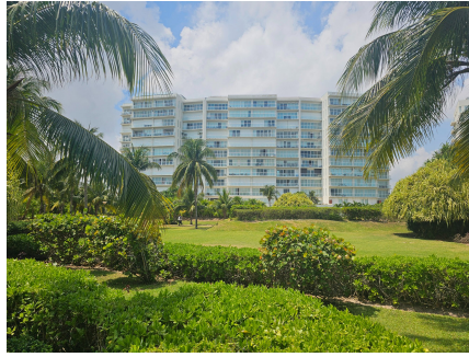
Amara Building — Gardens with BBQ