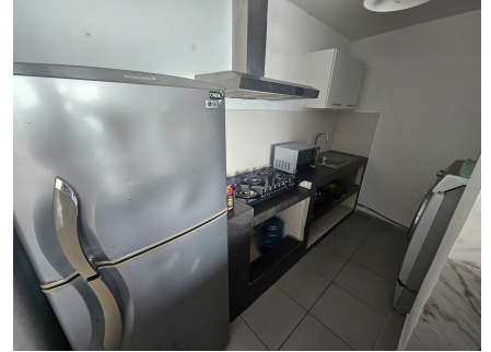
Espacio de Cocina