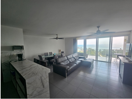
Sala-Comedor con Vista al Mar