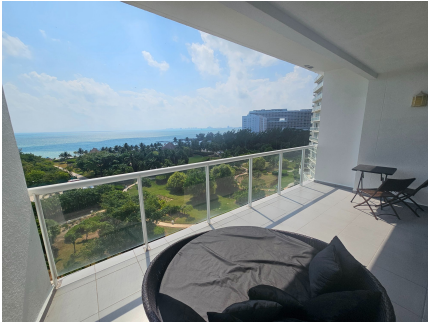
Panoramic Balcony — Caribbean Sea