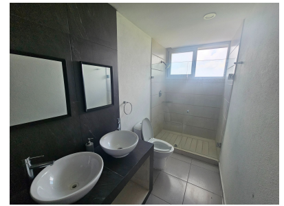
Baño Moderno — Doble Lavabo