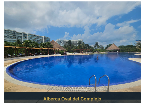
Alberca Oval del Complejo