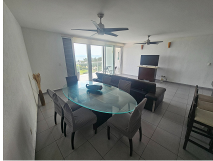
Comedor — Vista Panorámica