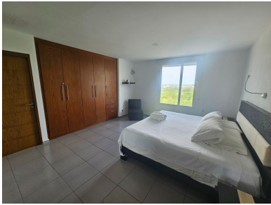
Master Bedroom — MDF Wardrobe