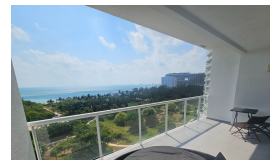
Balcony with Caribbean Sea View

■ Puerto Juárez, Cancún — Beachfront complex | 40 min from CUN Airport