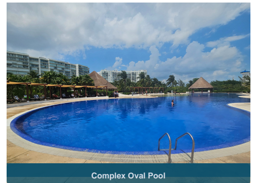
Complex Oval Pool