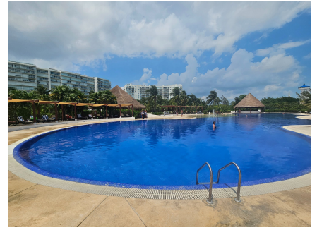
Alberca Oval — Camastros & Acceso a Playa