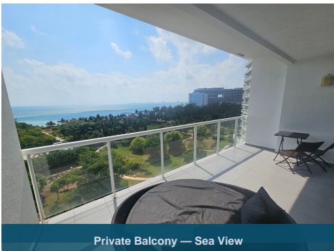
Private Balcony — Sea View