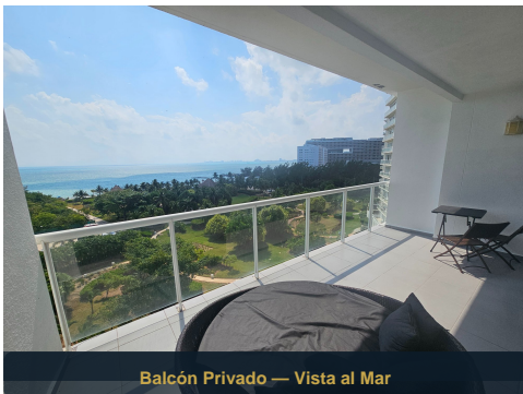
Balcón Privado — Vista al Mar